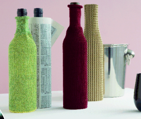
Dossier: Tarnanzüge für die Blindprobe zu Hause. Seite 82