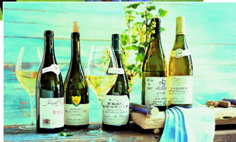
Kommen groß raus: Kleine Burgunder entlasten den Etat. Seite 64