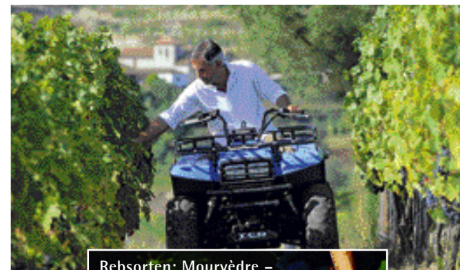
Rebsorten: Mourvèdre – erfolgreiche Reha. Seite 78