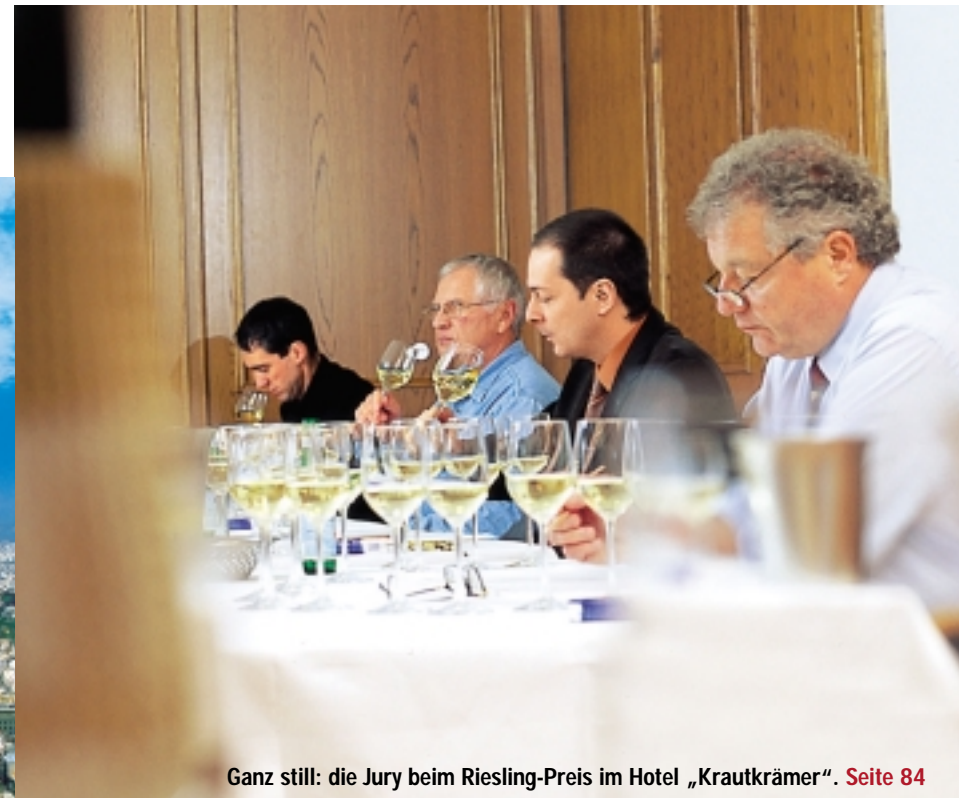
Ganz still: die Jury beim Riesling-Preis im Hotel „Krautkrämer“. Seite 84