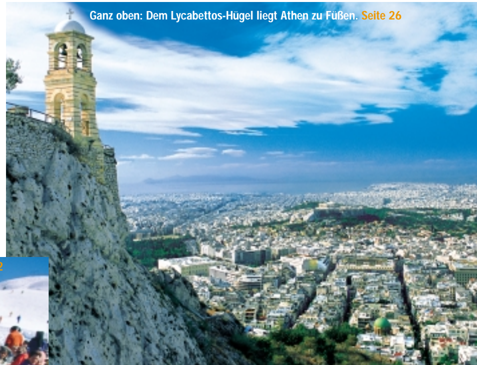
Ganz oben: Dem Lycabettos-Hügel liegt Athen zu Füßen. Seite 26