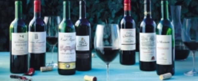
Ganz vorn – und erschwinglich: rote Bordeaux. Seite 91