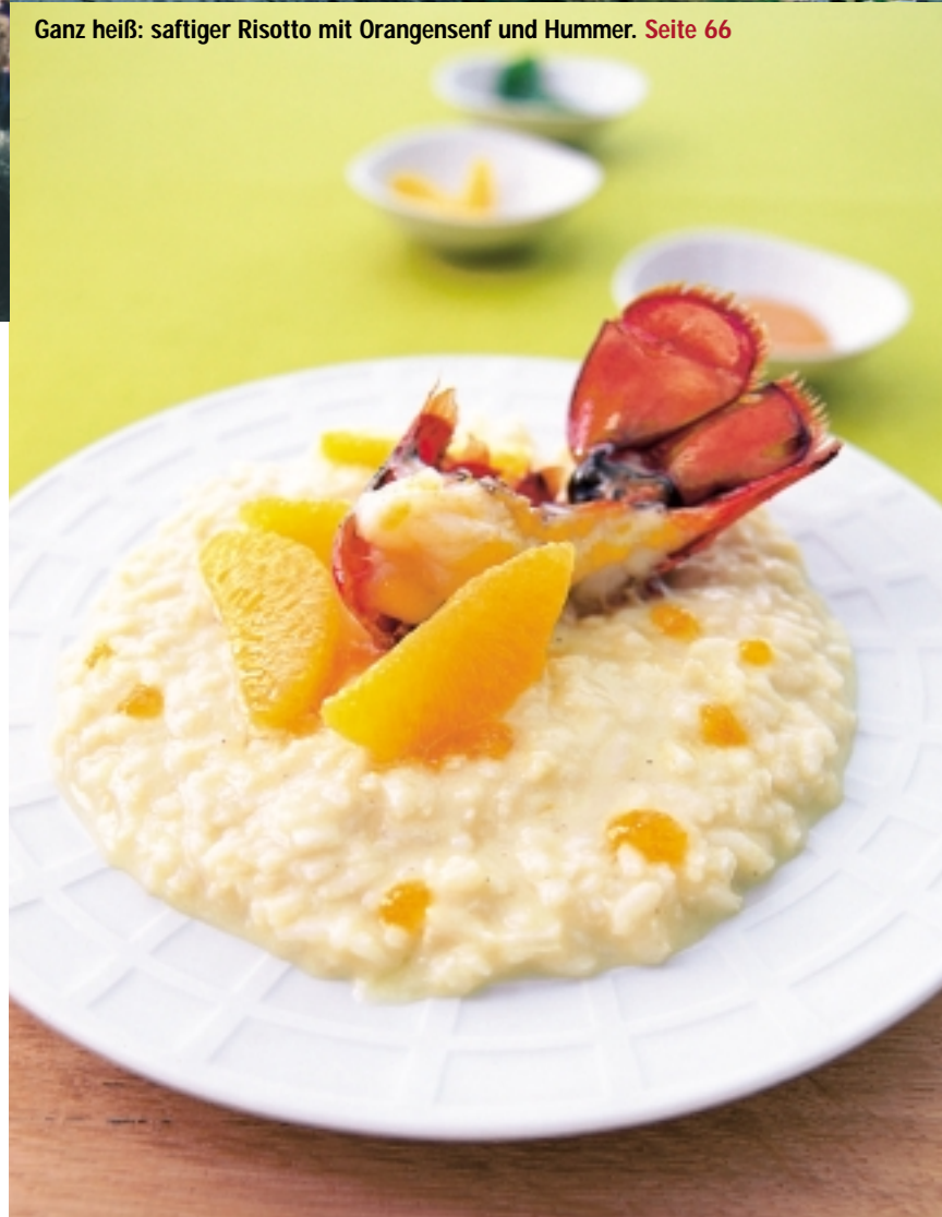
Ganz heiß: saftiger Risotto mit Orangensenf und Hummer. Seite 66