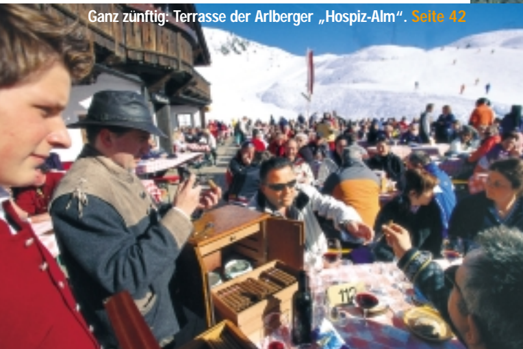
Ganz zünftig: Terrasse der Arlberger „Hospiz-alm“. Seite 42