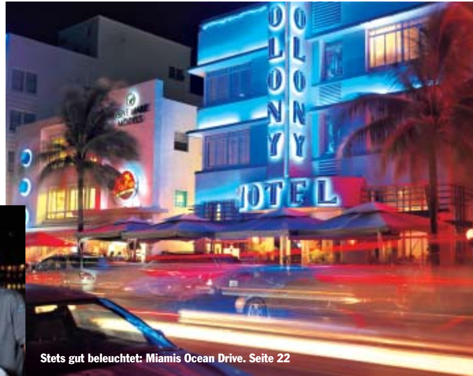
Stets gut beleuchtet: Miamis Ocean Drive. Seite 22