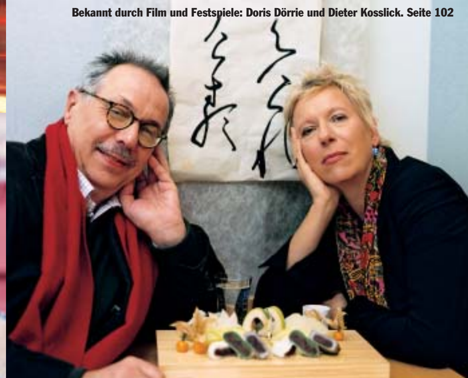
Bekannt durch Film und Festspiele: Doris Dörrie und Dieter Kosslick. Seite 102

FF RESTAURANTS, HOTELS UND WEINGÜTER: Die Erklärung unseres Bewertungssystems steht auf Seite 37.