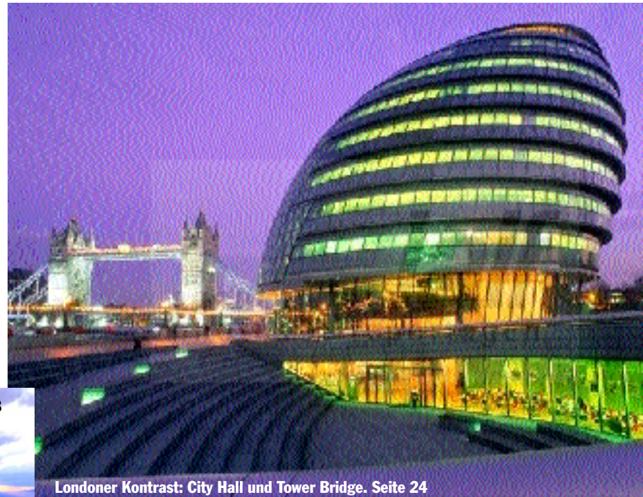
Londoner Kontrast: City Hall und Tower Bridge. Seite 24