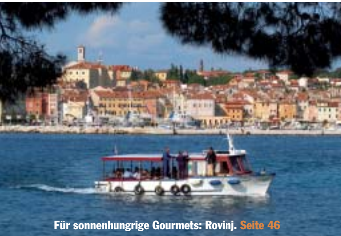
Für sonnenhungrige Gourmets: Rovinj. Seite 46