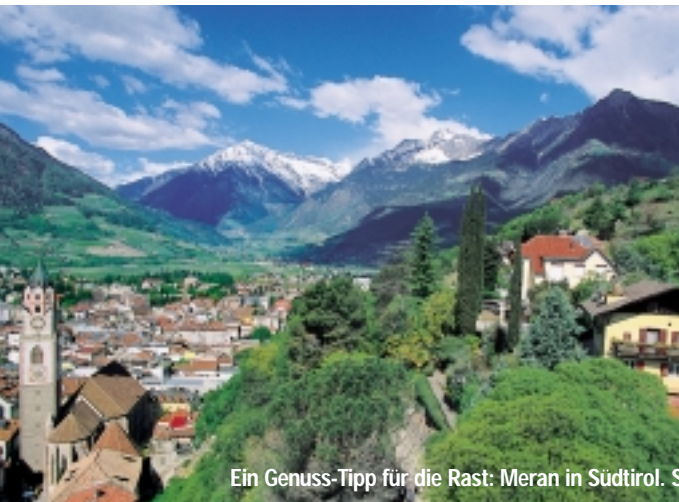
Ein Genuss-Tipp für die Rast: Meran in Südtirol. Seite 48