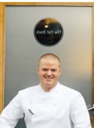
Hexerei am Herd: Heston Blumenthal vom „The Fat Duck“. Seite 64