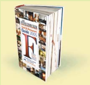
„DER FEINSCHMECKER Guide 2005“ mit 2000 Hotels und Restaurants in Deutschland, € 24,80