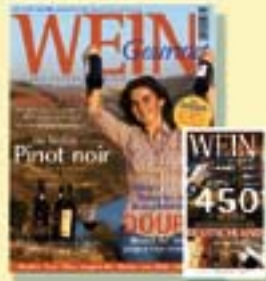
Aktuell: WEIN GOURMET 1/2005 mit der Broschüre „Die 450 besten Weinläden“, € 6,95