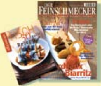
Neu: DER FEINSCHMECKER 6/2005 mit dem Special „30 tolle Fisch-Rezepte“, € 5,00