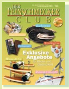
DER FEINSCHMECKER Club Magazin mit über 400 exklusiven Angeboten, kostenlos

Auch zu bestellen über: Telefon 040-87 97 35 60 oder www.der-feinschmecker-club.de