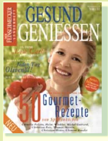
„Gesund genießen“ mit 50 Gourmet-Rezepten, DER FEINSCHMECKER Paperback, € 9,80