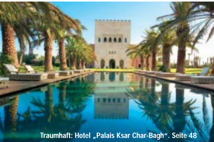
Traumhaft: Hotel „Palais Ksar Char-Bagh“. Seite 48