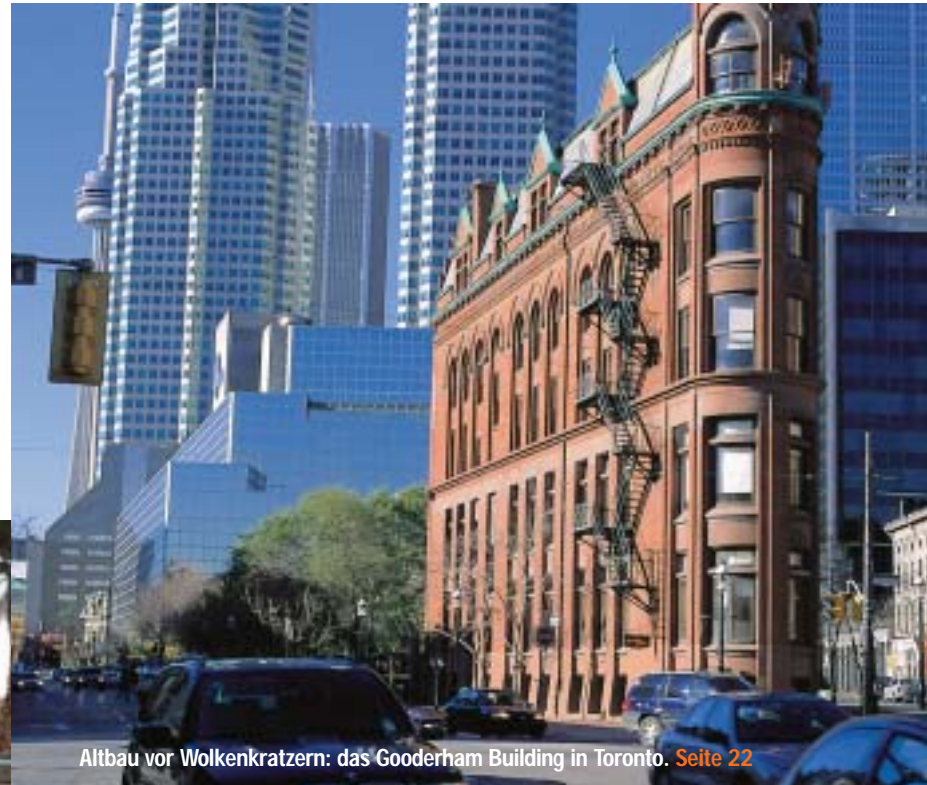
Altbau vor Wolkenkratzern: das Gooderham Building in Toronto. Seite 22

Elsass: Entdeckungen in der Idylle 58 Noch nie war es aufregender, jenseits des Rheins zu essen; stille Hotels machen die Erholung perfekt