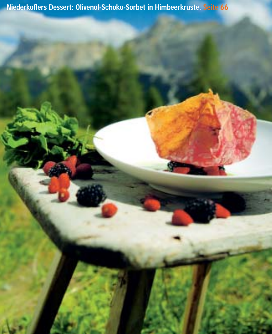
Niederkoflers Dessert: Olivenöl-Schoko-Sorbet in Himbeerkruste. Seite 66

Restaurant-Broschüre 2005: Von lauschigen Ausflugszielen bis zur Spitzengastronomie – mit diesem handlichen Begleiter sind Sie in ganz Deutschland gut beraten