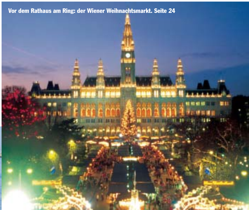
Vor dem Rathaus am Ring: der Wiener Weihnachtsmarkt. Seite 24