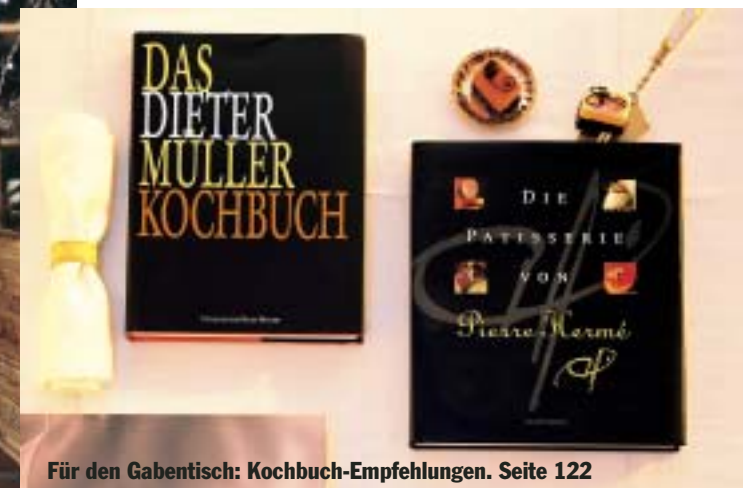
Für den Gabentisch: Kochbuch-Empfehlungen. Seite 122