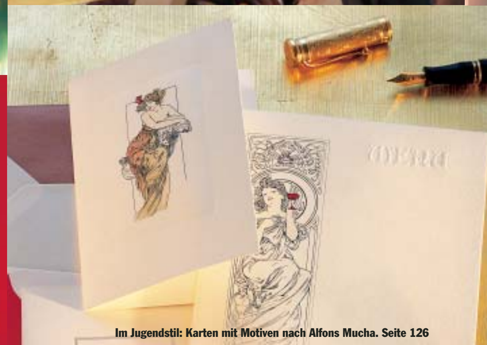
Im Jugendstil: Karten mit Motiven nach Alfons Mucha. Seite 126