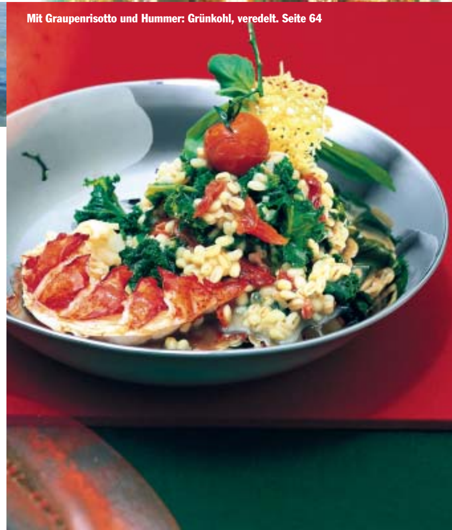
Mit Graupenrisotto und Hummer: Grünkohl, veredelt. Seite 64