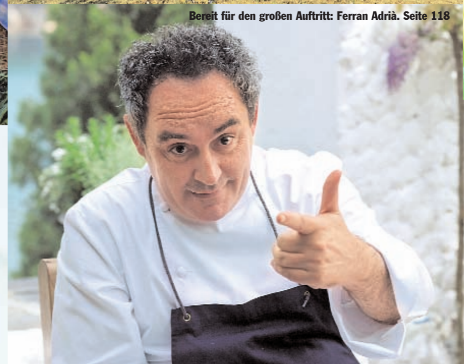
Bereit für den großen Auftritt: Ferran Adrià. Seite 118

FFF RESTAURANTS, HOTELS UND WEINGÜTER: Die Erklärung unseres Bewertungssystems steht auf Seite 40.