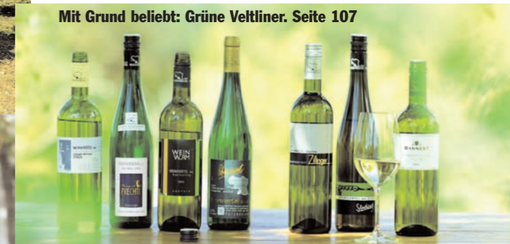
Mit Grund beliebt: Grüne Veltliner. Seite 107