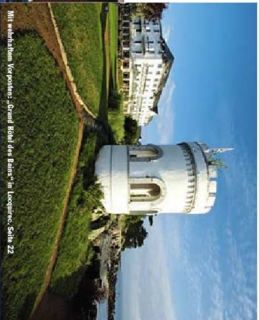
Mit weihnärfrem Vorposten: „Grand Hôtel des Bains“ in Lequintre. Seite 22