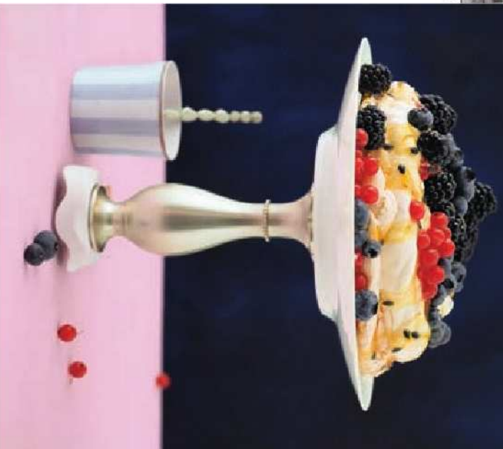
Sommerliche Baiserforte: Pavlova mit Beeren und Maracujasauce. Seite 58