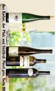
Aus Baden, der Pfalz und Südtrol: Pinot grigs. Seite 80