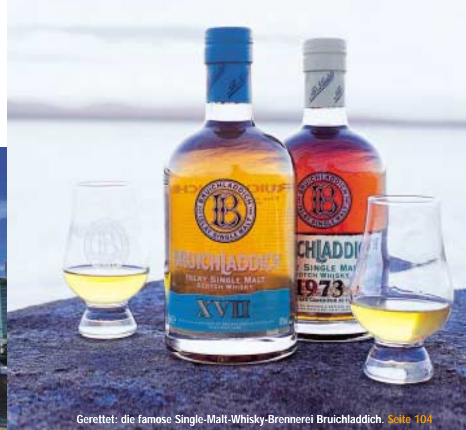
Gerettet: die famose Single-Malt-Whisky-Brennerei Bruichladdich. Seite 104

Jürgen Dollase über eine wenig bekömmliche Substanz, die das Trüffelaroma chemisch nachahmt