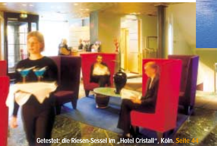
Getestet: die Riesen-Sessel im „Hotel Cristall“, Köln. Seite 44