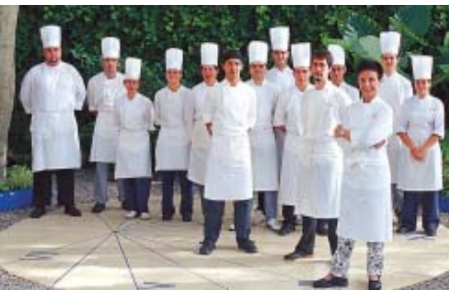
Kreatives Küchenteam in Katalonien: Top-Köchin Carme Ruscalleda vom Restaurant „Sant Pau“ in Sant Pol de Mar. Seite 24

Spanische Lebensart vor der Küste Afrikas: schöne Hotels und Sonne satt von Teneriffa bis Gran Canaria