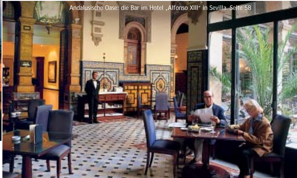
Andalusische Oase: die Bar im Hotel „Alfonso XIII“ in Sevilla. Seite 58