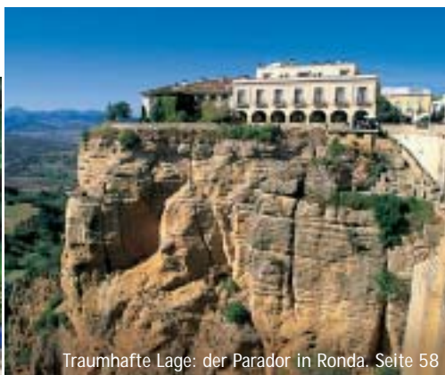
Traumhafte Lage: der Parador in Ronda. Seite 58