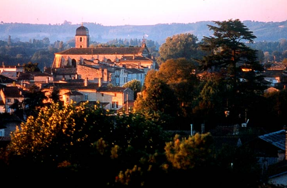
Côtes de Castillon: Eine lange vergessene Region des Bordelais zeigt Flagge. Seite 28