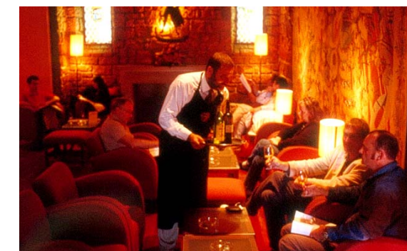
Weinbars in Lissabon: Plüsch und Portwein im „Solar do Vinho do Porto“. Seite 132