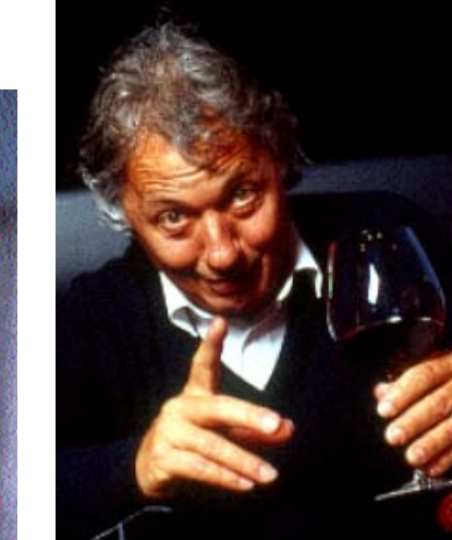
Kabarettist Beikircher: über Männer, deren Musik haltbarer war als ihre Leber. Seite 126