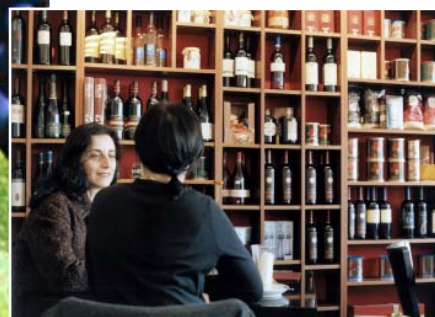
Ein Hauch von Katalonien: die Weinbar „Rincóns“ im Kölner Agnes-Viertel. Seite 118