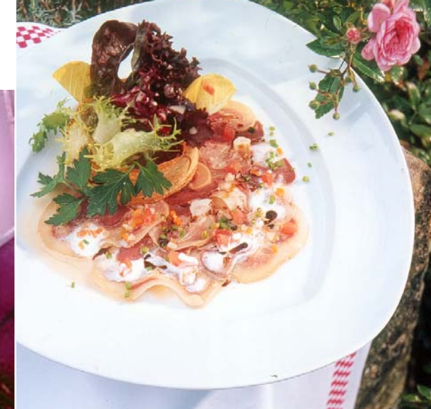
Rustikal: Im „Spielweg“ serviert Karl-Josef Fuchs marinierten Kalbskopf. Seite 106