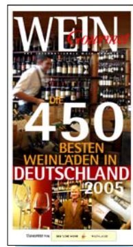
Weinläden, die wir empfehlen können