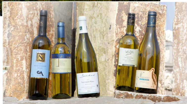
Trendweine: Sauvignon blanc aus deutschen Weinregionen. Seite 54