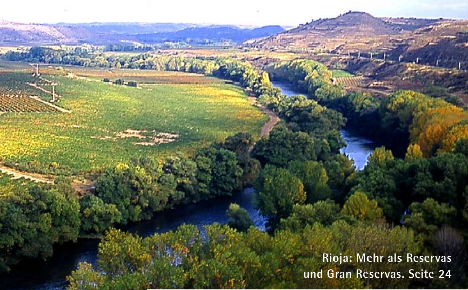
Rioja: Mehr als Reservas und Gran Reservas. Seite 24