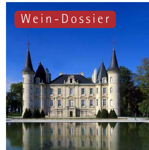
Die Qual der Wahl: Preisvergleich am laufenden Meter. Seite 82