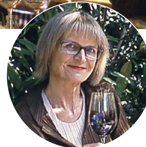
Weinautorin: Der Alltag von Jancis Robinson. Seite 106