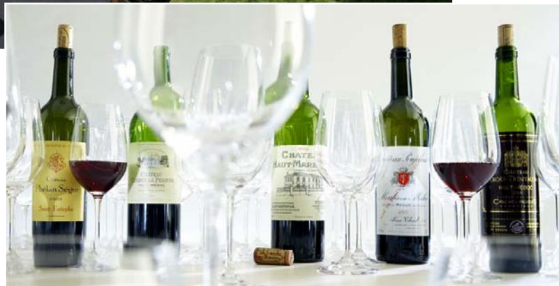
Crus bourgeois 2003: preiswerte Alternativen. Seite 58