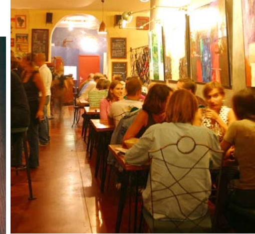
Das „La Part des Anges“ in Marseille ist alle Tage gut besucht (o.). Seite 136