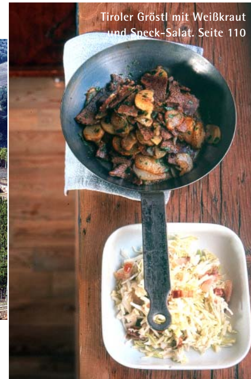
Tiroler Gröstl mit Weißkraut und Speck-Salat. Seite 110